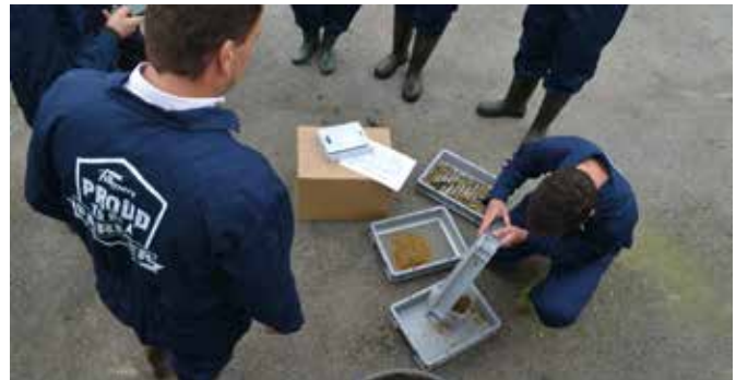
De schudbox geeft onmiddellijk een duidelijk beeld van de mengkwaliteit