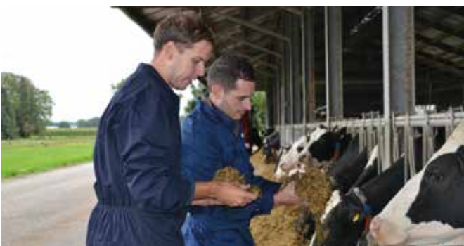
We controleren steeds het resultaat. Is alles goed gemengd?