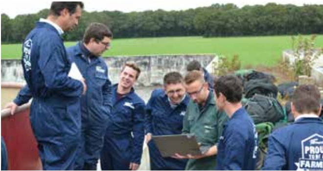
Eerst even het rantsoen correct rekenen en een laadlijst maken

Het rundveeteam van ForFarmers wil hun klanten steeds beter bedienen in deze uitdagende tijden. En net daarom hebben ze onlangs een studiedag gemengd voeren gevolgd. Deze winter is het een uitdaging om de rantsoenen te optimaliseren. Zowel qua inhoud maar zeker ook qua mengresultaat. En net dat is essentieel als we de productie van onze klanten op peil willen houden. Het rundveeteam van ForFarmers is met deze studiedag gemengd voeren meer dan voldoende gewapend om voor elke situatie een passende oplossing te vinden. En jij, als klant, zal er wel bij varen.