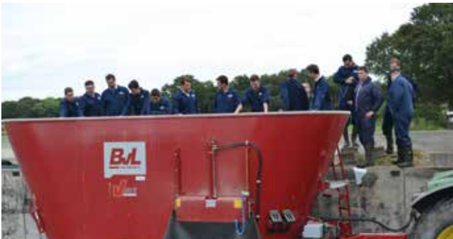
Ze volgen het volledige mengproces van dichtbij