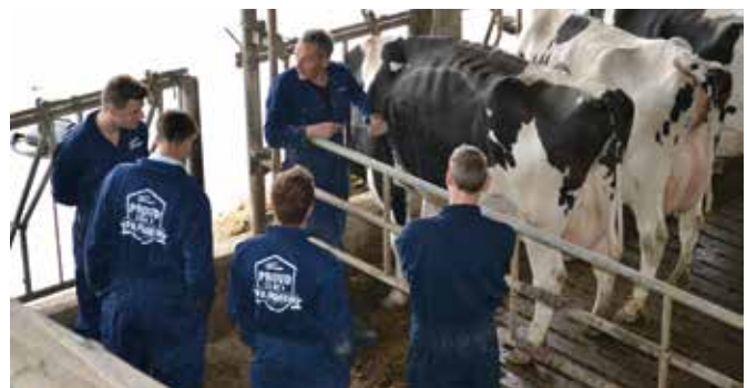
Ook de koeien vertellen veel over de mengkwaliteit van het rantsoen