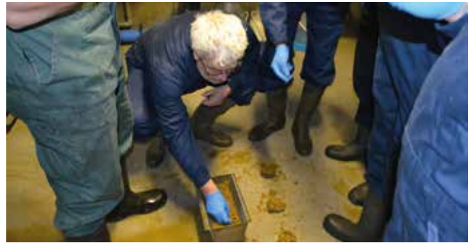
Wat vertelt de mest ons? Is alles goed verteerd?